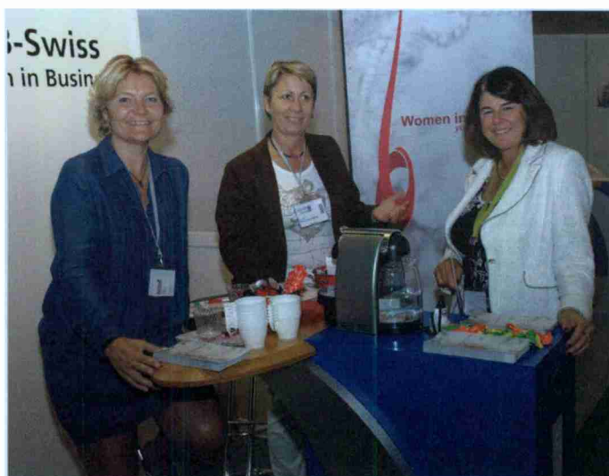
Les business-women en plein essor.

N° de thème: 32.1 N° d'abonnement: 32001 Page: 50 Surface: 65'444 mm 2