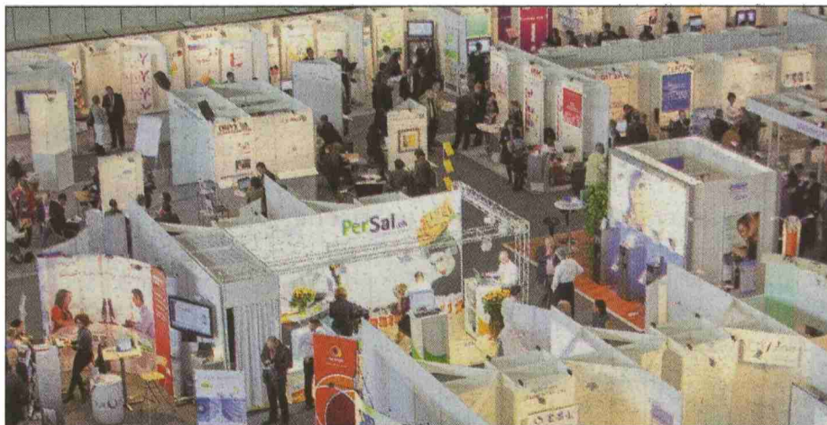
LE SALON RH rencontre du succès auprès des professionnels de la branche.

N° de thème: 32.1 N° d'abonnement: 32001 Page: 11 Surface: 90'252 mm 2