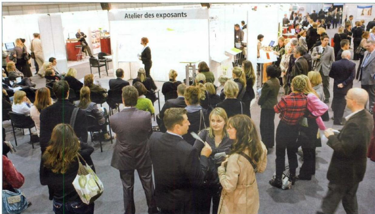
Plus de 2000 visiteurs sont attendus au salon RH.

afin d'en préserver le dynamisme, permettent l'amélioration des performances, etc. ■