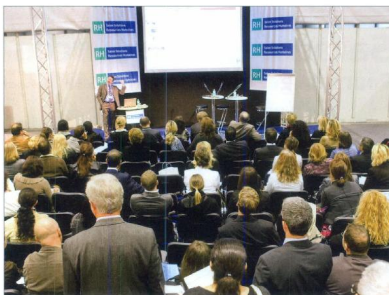
Des conférences courtes et ciblées pour une efficacité maximale.

A l'instar du salon Manageware qui se déroule en parallèle (voir page 31), le salon RH a adopté le système des «forums pratiques» qui s'intègrent dans la manifestation sous la forme d'espaces ouverts. Une quarantaine d'interventions sont d'ores et déjà agendées. Elles balayent une multitude de thèmes parmi lesquels la gestion des ressources humaines, l'outsourcing sur mesure, les logiciels de gestion professionnelle du personnel, le travail temporaire, l'actualité du droit du travail, le 2 e pilier, les assurances-maladie complémentaires, la formation, la gestion du temps, l'optimisation par la planification de l'embauche,